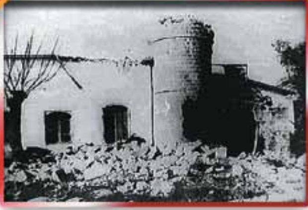
Rum terör çetelerinin 1963 yılındaki, Türklere yönelik saldırılarında, Osmanlı döneminden kalma camiler, tarihi eserler tahrip edildi. Resimde yıkılmış bir Türk camisi görülüyor.

abluka altına aldı. Stratejik madde olarak nitelendirdiği çimento, demir, çivi, kereste, benzin gibi maddelerin Türk bölgelerine girişini yasakladı. Türk halkı açlık ve yoksulluğun pençesine itilmek istendi. Dikkat çekici olan ise, tüm dünyanın Kıbrıs'ta olup bitenlere seyirci kalması, büyük bir zulme maruz kalan Türklerin çağrılarına kulaklarını tıkamasıydı. Elbette bu yaklaşım, sorunu çözmek bir yana daha da alevlendirdi.