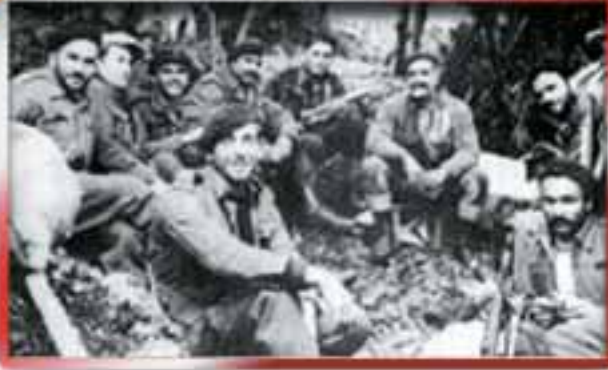
Kanlı terör örgütü EOKA'nın militanları