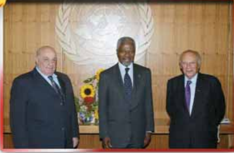
KKTC Cumhurbaşkanı Rauf Denktaş, BM Genel Sekreteri Kofi Annan ve Kıbrıs Rum Kesimi eski lideri Glafkos Klerides birarada

formüllerin sonuncusu, 2003 yılında BM Genel Sekreteri Kofi Annan tarafından sunulan plandır. Devletimiz ve KKTC yönetimi bu planın sakıncalarını tespit ederek kabul edilmezliğini vurgulamışlardır. Bilim Araştırma Vakfı, bu konudaki politikayı son derece yerinde bulmakta, bu ve benzeri baskılara kahramanca göğüs geren Sayın Rauf Denktaş'ı desteklemektedir.