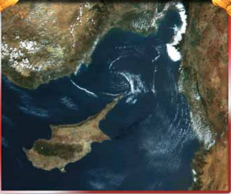
Kıbrıs'ın uydu fotoğrafındaki görünüşü

Bu kitapta, önce Kıbrıs sorununun tarihsel gelişimi ele alınmakta, ardından BAV'ın Kıbrıs için çözüm önerisi ortaya konmaktadır. Sonra da, Bilim Araştırma Vakfı tarafından 6 Şubat ve 22 Şubat 2003 tarihlerinde İstanbul ve Ankara'da düzenlenen "Kıbrıs İçin Gerçek Çözüm" başlıklı panellere katılan sayın konuşmacıların değerleri görüşleri aktarılmaktadır.