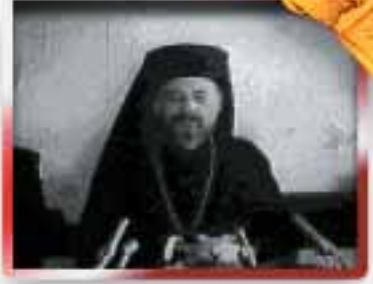
Baş Piskopos Makarios

"Adada kendilerine bas özelliklerini devam ettirebilecek iki cemaat, yani Türk ve Rum cemaatleri vardır. Bunları temsil eden iki cemaat meclisi, bütün işlerde ortak hareket edilmesini sağlayacaktır.