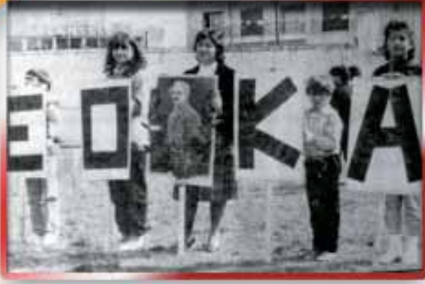
EOKA yanlısı Rumlar

1967'de, Anayasa'nın savaş ilanına ve Türk Silahlı Kuvvetleri'nin yabancı ülkelere gönderilmesine ilişkin 66. maddesine dayanarak Kıbrıs'a müdahale kararı aldı. Bu karar, meclisteki 435 üyenin 432'sinin oyu ile kabul edildi. 25 Ancak Amerika Birleşik Devletleri'nin devreye girmesi ve Yunanistan'ın Türkiye'nin şartlarını kabul etmesiyle, Türk hareketi bir kez daha durduruldu.