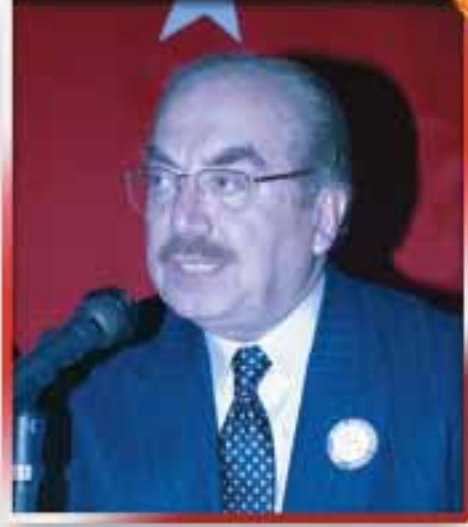
Agah Oktay Güner

rek sözlerime başlamak istiyorum. Aynen Kuvay-ı Milliye döneminde olduğu gibi, siyasi iktidarın milli menfaate ne ölçüde hizmet ettiğinden endişe duyan Türkiye'nin bütün aydınları, Türkiye'nin hemen her köşesinde bu tip toplantılar tertip etmektedir. Ankara'da Türk Ocakları'nın başkanlığında, Türk Dünyası Dayanışma Grubu ve diğer bütün gruplar, bir gerçeği yeniden anlatmak ve yeniden idrak etme gayreti içerisindeyler.