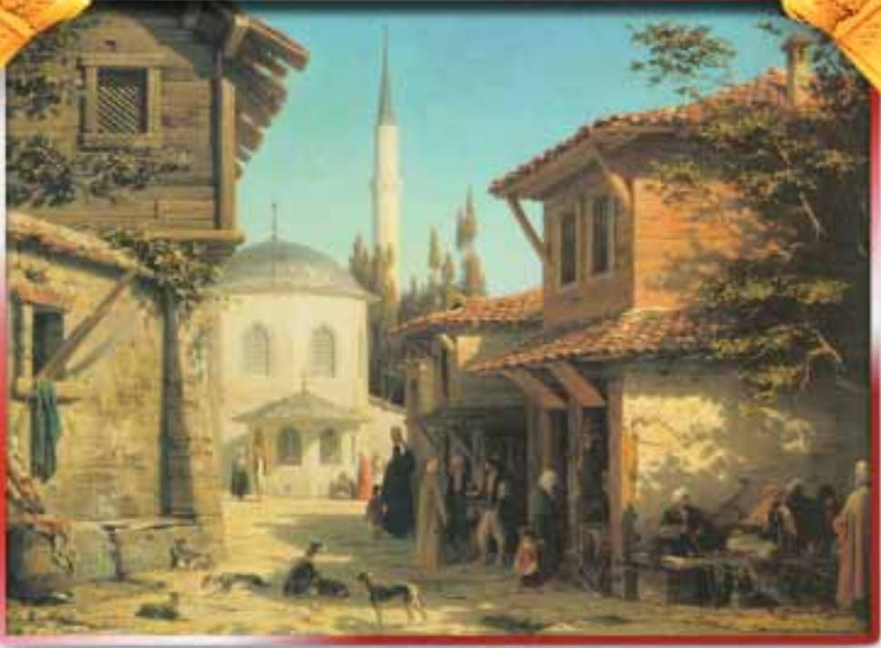
Osmanlı'da günlük yaşamı konu alan bir yağlıboya tablo

olmasına rağmen, Osmanlı İmparatorluğu "çoğulcu bir toplum düzeninin klasik bir örneğini" teşkil ediyordu. Bugün bu konuda arşiv kaynaklarına inerek inceleme yapan Batı araştırmacılarının ortak kanısına göre, bazı eksikliklerine rağmen, Osmanlı Devleti bünyesindeki ulusları huzur ve refah içinde yaşatmıştır. Ayrıca, azınlıklara karşı olan tutumları açısından Osmanlı Devleti fethettiği topraklarda kendisinden sonra oluşan devletlere kıyasla en mükemmel sicile sahiptir. 7