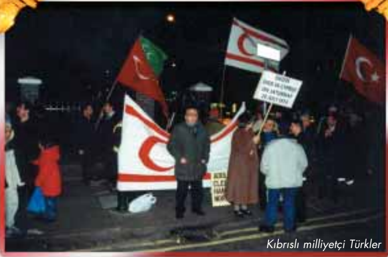
Kıbrıslı milliyetçi Türkler