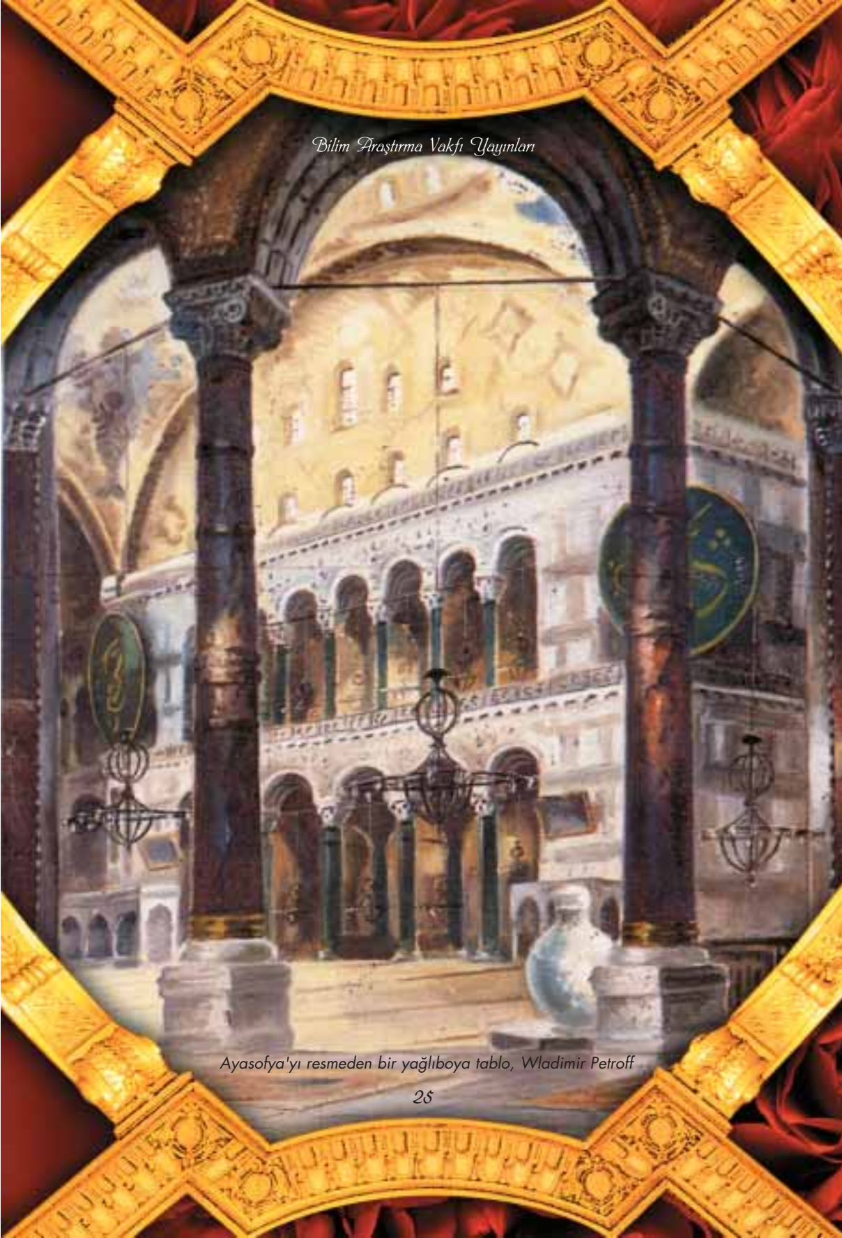
Ayasofya'yı resmeden bir yağlıboya tablo, Wladimir Petroff