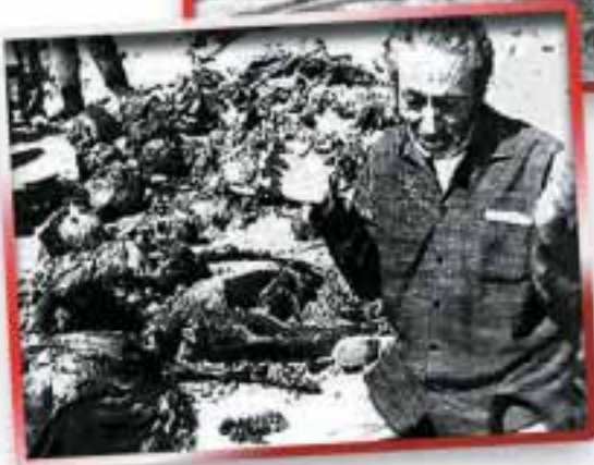
İnsanlık dışı uygulamalara maruz kalan ve öldürülen Türkler, Rumlar tarafından toplu mezarlara gömüldüler. (Üstte) Toplu mezarda ağlayan bir Türk. (Solda)

günümüzde Kuzey Kıbrıs Türk Cumhuriyeti topraklarını oluşturan bölge, Lefke-Lefkoşe-Magosa hattının kuzeyi, yani adanın yaklaşık %37'si kontrol ve güvence altına alınmıştır. Harekat, adından da anlaşıldığı gibi, Kıbrıs'a barış, huzur ve özgürlük ortamı getirmiş, Kıbrıs Türklerini zulüm, baskı ve yok olmaktan kurtarmıştır. Adanın Yunanistan'a bağlanması tehlikesini tamamen ortadan kaldırmıştır. Türklerin bugün adada güvenlik içinde ve özgürce yaşamaları, 1974 Barış Harekatı ile olmuştur.