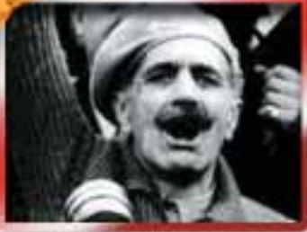
EOKA lideri Grivas

he Partisi, Kıbrıs Adası Türk Azınlığı Kurumu, Kıbrıs Milli Türk Halk Partisi, Kıbrıs Türk Kurumları Birliği, Kıbrıs Türk Kurumları Federasyonu ve Kıbrıs Milli Türk Birliği gibi cemiyetlerin çatısı altında onurlu mücadelelerini sürdürdüler.