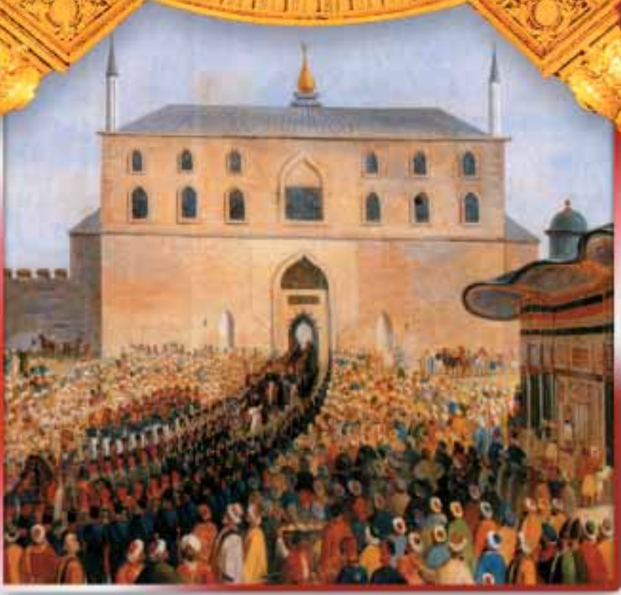
Sultan II. Mahmut'un Cuma Selamlığı, François Dubois'nın yağlıboya resminden ayrıntı.

tan'la birleşmelerini temsil eden armağanları, valinin kasabalarını ziyaret sırasında verirken, mızraklı bir alay gibi sıraya sokulan öğrenciler de, önceden öğretilmiş olan "Yaşasın Enosis" çığlıkları atıyorlardı. 17